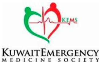
Kuwait Emergency Medicine Society